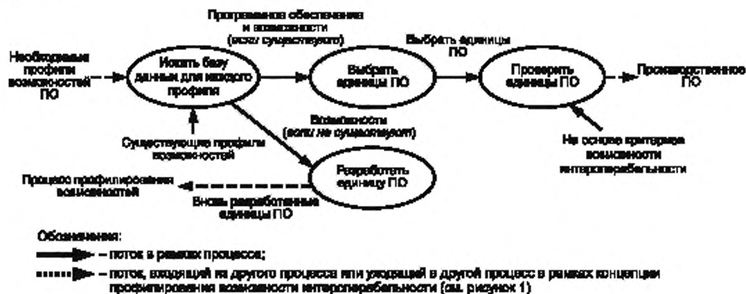
Рисунок 4 — Процесс выбора, проверки или создания единицы программного обеспечения

Часть интеграции профиля возможности (см. рисунок 1), имеющая отношение к выбору и проверке (верификации) единицы программного обеспечения или к процессу ее создания, представлена на рисунке 4.