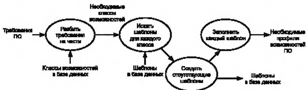
Рисунок 3 — Процесс анализа требований программного обеспечения

Профили возможностей каждой единицы производственного программного обеспечения являются производными от требований производственного программного обеспечения в процессе их анализа. Сначала требования производственного программного обеспечения разбивают на несколько простых требований, которые выполняются классами возможностей, отобранными из базы данных. В случае, если шаблон, соответствующий классу, существует, то его заполняют специфическими требованиями для создания необходимого профиля возможностей. В случае, если такого шаблона нет, то новый шаблон создают с применением правил создания шаблона, приведенных в 6.3.