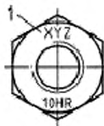
1 — маркировка товарного знака изготовителя болтокомплекта