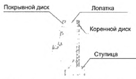
Рисунок А.7 – Крепление лопаток радиальных вентиляторов с помощью шипов