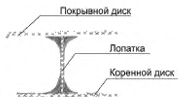
Рисунок А.6 – Крепление лопаток радиальных вентиляторов с приформовкой