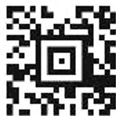
Рисунок 2 – Символ Aztec Code

Пример символа Aztec Code приведен на рисунке 2.