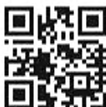
Рисунок 1 – Символ QR Code

Пример символа QR Code приведен на рисунке 1.