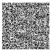
Рисунок 5 — Пример изображения двумерного символа штрихового кода с графическим маркером стандарта

Пример изображения двумерного символа штрихового кода с графическим маркером стандарта приведен на рисунке 5.