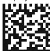
Рисунок 3 — Символ Data Matrix