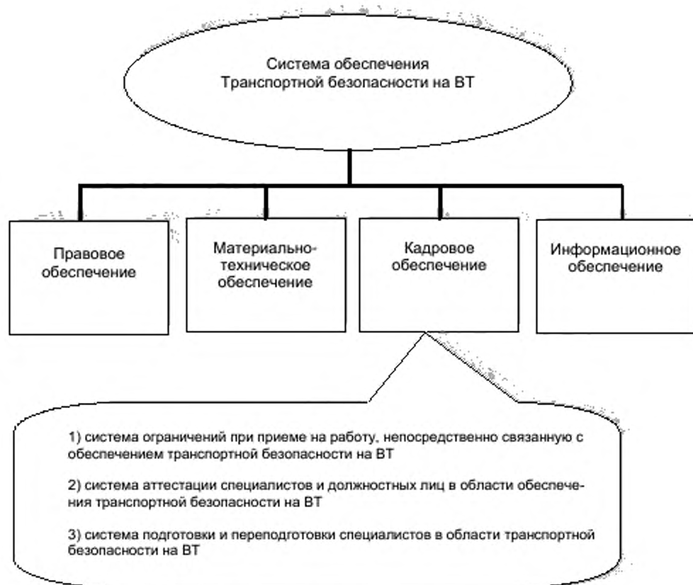
Рисунок 1 — Место кадрового обеспечения транспортной безопасности в общей системе обеспечения транспортной безопасности в Российской Федерации

Каждый из указанных элементов представляет собой подсистему определенных взаимосвязанных элементов.