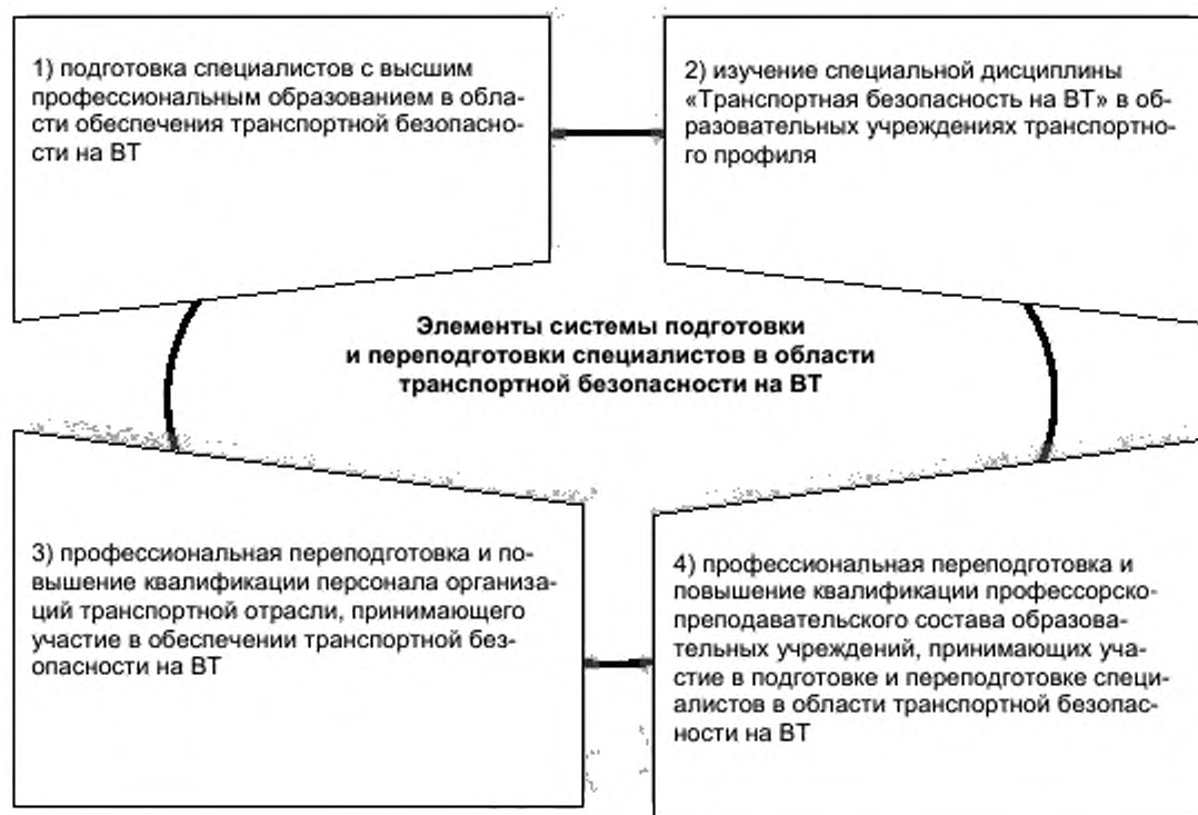
Рисунок 2 — Система подготовки и переподготовки специалистов в области обеспечения транспортной безопасности на ВТ в Российской Федерации (перспективная модель)

Согласно Комплексной программе обеспечения безопасности населения на транспорте, утвержденной распоряжением Правительства Российской Федерации от 30 июля 2010 г. № 1285р, создание системы профессиональной подготовки и обучения специалистов и должностных лиц в области обеспечения транспортной безопасности на ВТ, а также персонала, принимающего участие в обеспечении транспортной безопасности на ВТ, в том числе в части предотвращения и защиты от чрезвычайных ситуаций природного и техногенного характера на транспорте, является одним из приоритетных направлений обеспечения транспортной безопасности на ВТ в Российской Федерации.