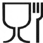
Рисунок Б.1 – Для пищевых продуктов

Б. 2 Символ, характеризующий кронен-пробки по назначению, наносят на упаковочный ярлык или упаковочный лист (вкладыш) или указывают в сопроводительной документации — см. рисунок Б.1.