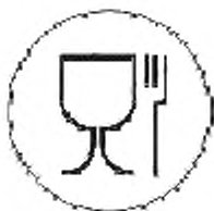
Рисунок А.1—Для пищевых продуктов

А.3 Символ и знаки, наносимые на изделия или упаковочный ярлык, или упаковочный лист (вкладыш), или сопроводительную документацию, характеризующие изделия по назначению: рисунки А.1 и А.2.