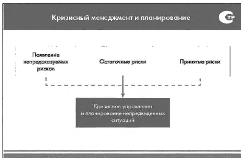
Рисунок 1 — Кризисный менеджмент и планирование

Цель кризисного управления состоит в том, чтобы подготовиться к кризисам так, чтобы наносимый ими ущерб был минимален. Много кризисных событий происходит одинаково и приводит к аналогичным последствиям независимо от того, вызваны ли они различными рисками. В случае если риск, который вызывает кризисные проявления, является вновь возникающим (как это часто бывает), а потому не зафиксированным на стадии идентификации, для такого риска может использоваться план действий для непредвиденных ситуаций.