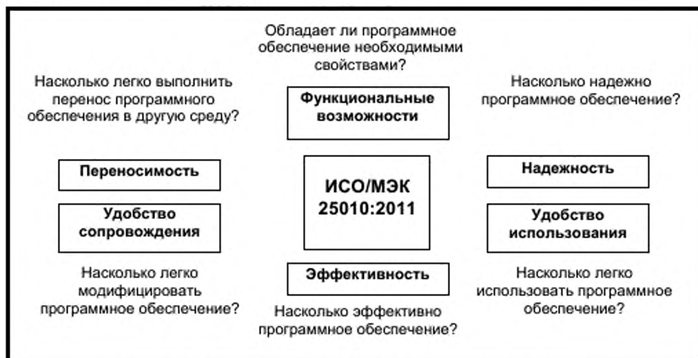
Рисунок 1 – Модель оценки качества программного обеспечения по ИСО/МЭК 25010:2011

6.1.1 Программное обеспечение, которое поддерживает статистические вычисления, следует разрабатывать в соответствии с системой качества программного обеспечения. Модель оценки качества программного обеспечения приведена в ИСО/МЭК 25010 (см.[7]). Положения этого стандарта касаются ряда подпунктов настоящего стандарта.