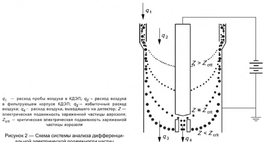
Рисунок 2 — Схема системы анализа дифференциальной электрической подвижности частиц

После прохождения детектора дальнейший анализ частиц невозможен. Могут быть использованы дополнительные пробоотборники параллельно с САДЭП для отбора проб с целью дальнейшего анализа, например электростатический или термический осадитель.