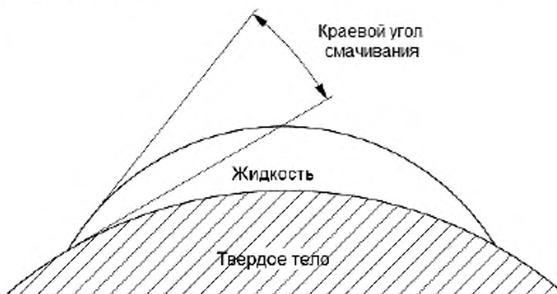
Рисунок 1 — Схематичное изображение краевого угла смачивания

3.2 краевой угол смачивания (contact angle): В общем случае, угол, образуемый двумя плоскостями, касательной к поверхности жидкости и границе разделения «твердое тело-жидкость», при их пересечении (см. рисунок 1). Частным случаем является краевой угол смачивания жидкого припоя с поверхностью твердого металла.