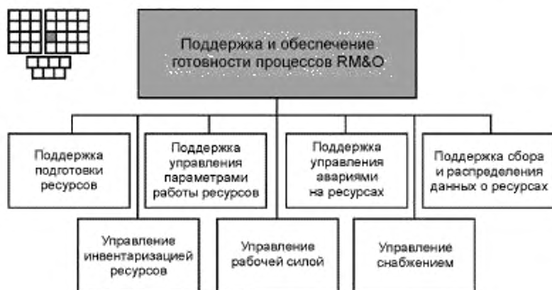
Рисунок 3 — Декомпозиция процесса 1.1.3.1 — «Поддержка и обеспечение готовности процессов RM&amp;O» на элементы процессов уровня 3

6.2 Процесс 1.1.3.1 и его элементы процессов уровня 3 предназначены для обеспечения возможностей выполнения и готовности процессов FAB: подготовки ресурсов, управления авариями на ресурсах, управления параметрами работы ресурсов, сбора и распределения данных о ресурсах, а также для выполнения процессов управления инвентаризацией ресурсов, рабочей силой и материально-техническим снабжением.