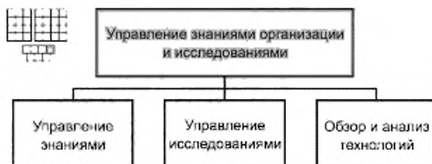
Рисунок 3 — Декомпозиция группы процессов «Управление знаниями организации и исследованиями» на элементы процессов уровня 2

6.2 Процессы группы 1.3.4 предназначены для управления знаниями, которыми располагает организация, для управления исследованиями новых технологий электросвязи и определения целесообразности их применения в организации, для планирования инвестиций и назначения приоритетов выполнения НИОКР (научно-исследовательских и опытно-конструкторских работ), обеспечивающих внедрение новых технологий.