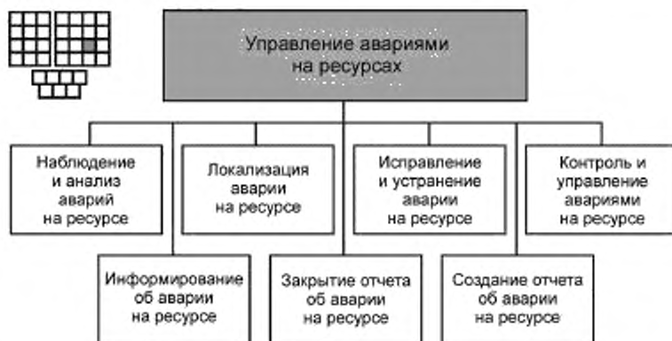
Рисунок 3 — Декомпозиция процесса 1.1.3.3 — «Управление авариями на ресурсах» на элементы процессов уровня 3

Примечание — К авариям на ресурсах относятся неисправности, нарушения в работе ресурсов и случаи деградации параметров работы ресурсов, связанные с отказами ресурсов.