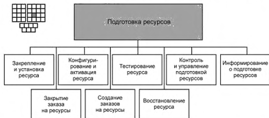
Рисунок 3 — Декомпозиция процесса 1.1.3.2 — «Подготовка ресурсов» на элементы процессов уровня 3

6.2 Процесс 1.1.3.2 и его элементы процессов уровня 3 предназначены для создания и выполнения заказов на ресурсы посредством подготовки ресурсов оказанию услуг. Заказы на ресурсы создаются в ответ на запросы от процессов: обработки заказов на услуги, восстановления ресурсов после отказов, контроля производительности ресурсов, поставки ресурсов поставщиками/партнерами.