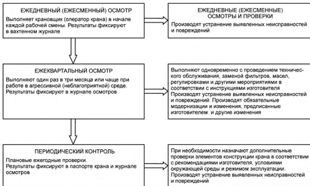
Рисунок Б.1 — Проведение технического контроля при наличии инструкций изготовителя