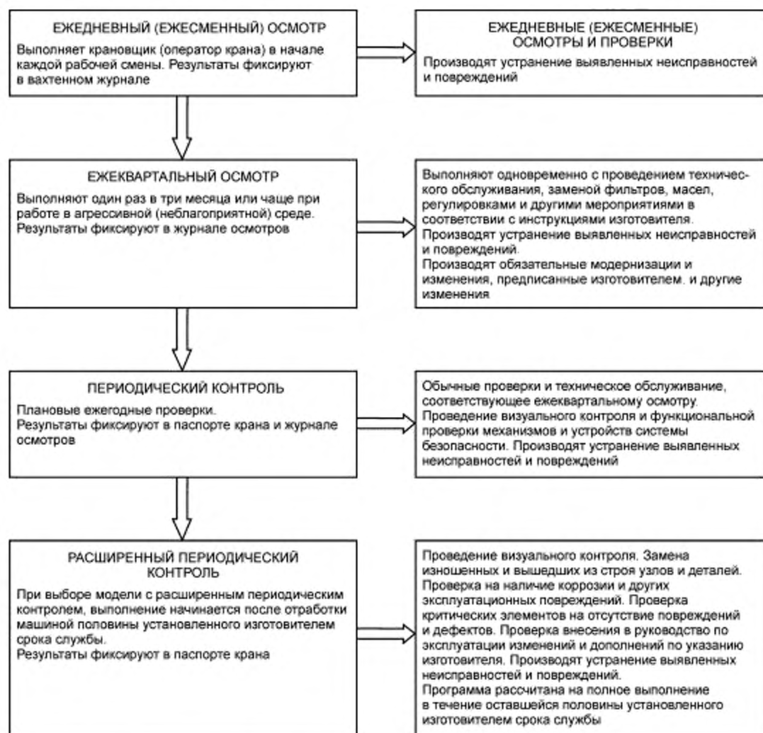
Рисунок Б.2 — Проведение технического контроля для кранов, отработавших до половины установленного изготовителем срока службы, в тех случаях, когда принята схема проведения технического контроля с применением расширенного периодического контроля, а инструкции изготовителя отсутствуют или признаны некорректными