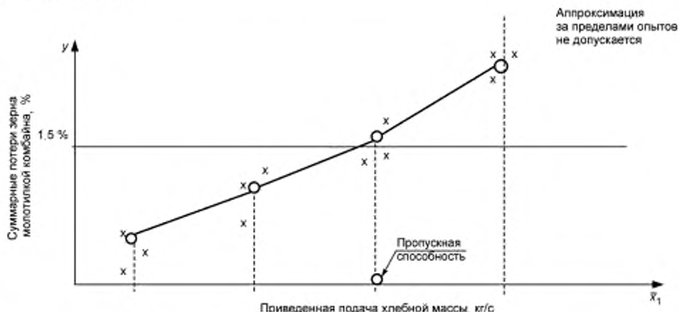
Рисунок 2 — График зависимости потерь зерна молотилкой комбайна от приведенной подачи хлебной массы

7.4.41 Аппроксимацию полученных данных производят, используя стандартизованные методы математической обработки.