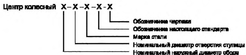
Рисунок 1 — Схема условного обозначения колесных центров

Схема условного обозначения колесных центров приведена на рисунке 1.