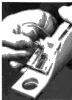
Рисунок 2 — Очистка прибора