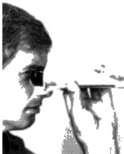
Рисунок 4 — Снятие показаний

П р и м е ч а н и е 3 — Температурная шкала прибора обратна шкале стандартных термометров. Значения отрицательных температур расположены в верхней половине шкалы.