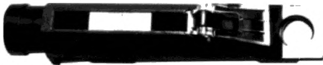
Рисунок 1 — Ручной рефрактометр предельного угла

6.2 Телескопический утопленный окуляр находится на одном конце, а полупрозрачная призма — на противоположном (см. рисунок 1).