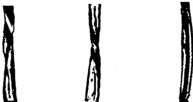
Рисунок Б.1 — Бактериально-грибковое заражение волокна отсутствует (I группа)