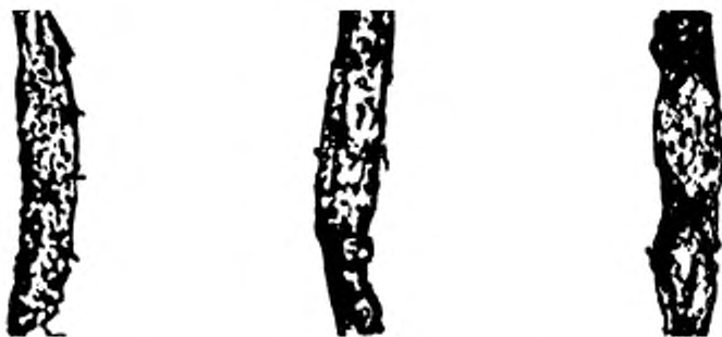
Рисунок В.4 — Бактериально-грибковое заражение волокна сильной степени (IV группа)