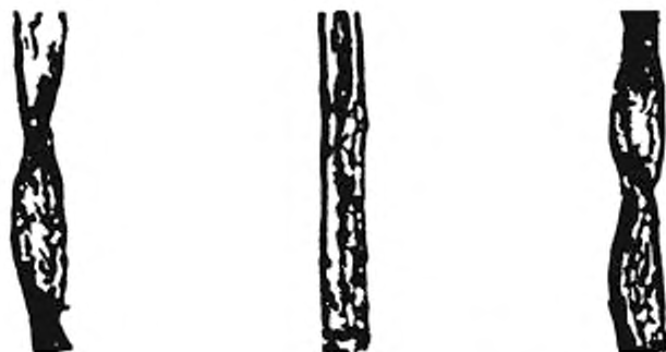
Рисунок Б.2 — Бактериально-грибковое заражение волокна слабой степени (II группа)