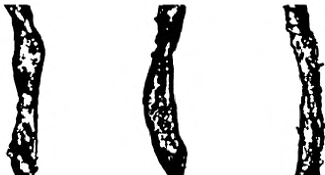
Рисунок Б.3 — Бактериально-грибковое заражение волокна средней степени (III группа)