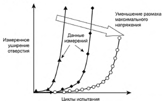
Рисунок 3 — Типичная зависимость расширения отверстия от количества циклов нагружения