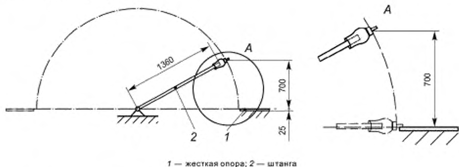
Рисунок 4 — Испытание стойкости несъемного конька к удару в горизонтальном положении

5.5.5 Испытание проводят на стенде типа маятникового копра со стальной штангой диаметром 25 мм длиной 1360 мм (см. рисунок 4).