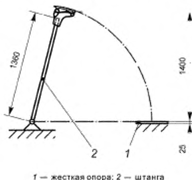
Рисунок 5 — Испытание стойкости несъемного конька к удару в вертикальном положении передней частью полоза конька

5.5.10 При испытании стойкости несъемного конька к удару в вертикальном положении передней части полоза конька колодку поворачивают вокруг оси штанги на (90 \pm 1)^\circ , штангу поднимают на высоту 1400 мм над поверхностью жесткой опоры и затем опускают (см. рисунок 5). Испытание проводят три раза.