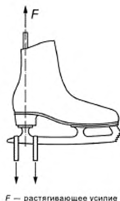
F — растягивающее усилие

5.4.3 К полозу/корпусу конька прикладывают квазистатическую растягивающую нагрузку до значения 2000 Н со скоростью (100 \pm 10) мм/мин. Схема приложения нагрузки показана на рисунке 3.