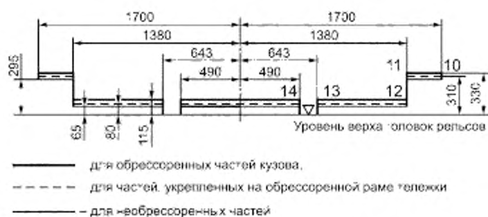
Рисунок Б.1 — Верхняя часть габарита подвижного состава для эксплуатации на колее 1067 мм