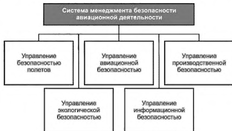
Рисунок 1 — Структура СМБАД