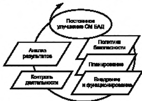
Рисунок 2 — Модель МБАД

Модель системы менеджмента безопасности авиационной деятельности представлена на рисунке 2 и основывается на цикле PDCA [Plan (планируй), Do (делай), Check (проверяй), Act (действуй)].