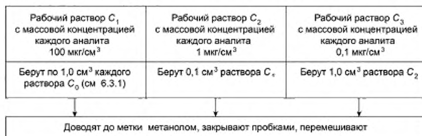
Рисунок 1 — Приготовление рабочих растворов C_1 , C_2 , C_3

Рабочие растворы C_1 , C_2 , C_3 готовят в мерных колбах вместимостью 10 см 3 согласно рисунку 1.