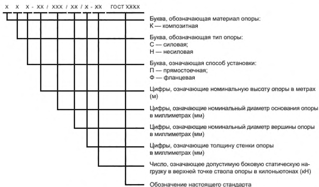
Рисунок 4.3 — Структурная схема маркировки композитных опор

4.3.3 Условное обозначение композитной опоры в технической документации и при заказе должно состоять из разделенных дефисами буквенно-цифровых групп, порядок и значения которых должны соответствовать схеме, приведенной на рисунке 4.3.