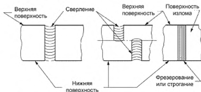
Рисунок 1 — Процесс отбора точечной пробы от кусков труднодробимого феррохрома

а) Если верхнюю и нижнюю поверхности кусков легко определить, то точечную пробу в виде стружки получают путем фрезерования, строгания или сверления по всей высоте куска от верхней поверхности до нижней, как указано на рисунке 1.