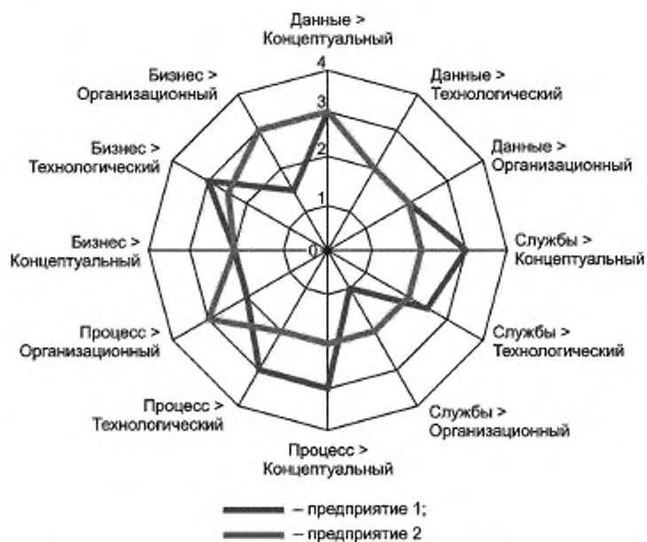
Рисунок 3 — Представление оценок зрелости интероперабельности предприятий, рассматриваемое с точки зрения видов аспектов/барьеров