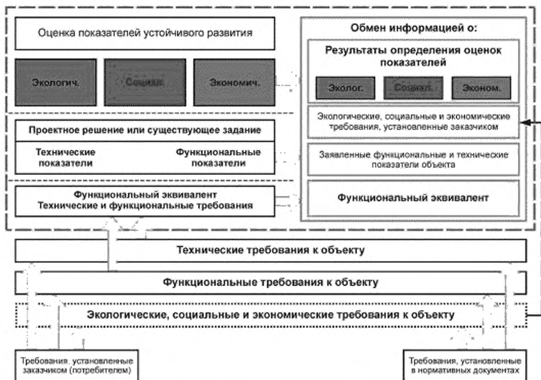
Рисунок 1 — Структура определения оценки показателей устойчивого развития строительного объекта