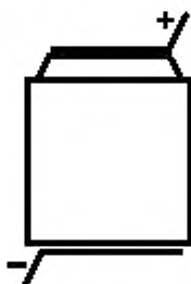
Рисунок 3 — Соединение крышка—дно корпуса KR...НВ