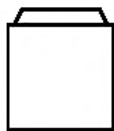
Рисунок 2 — Соединение крышка—крышка KR...НН