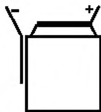
Рисунок 1 — Аккумуляторы без выводов KR...CF