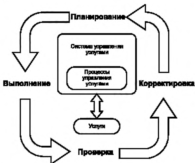
Рисунок 2 — Применение методологии PDCA в управлении услугами

Подход к совершенствованию, изложенный в ИСО/МЭК 20000-1:2011, основан на методологии PDCA. На рисунке 2 показано, каким образом можно применять методологию PDCA к СУУ, в том числе к процессам управления услугами, описанным в ИСО/МЭК 20000-1:2011 (разделы 5 и 9), и к самим услугам. Каждый элемент методологии PDCA зависит от предыдущего элемента и обязателен для успешного внедрения СУУ.