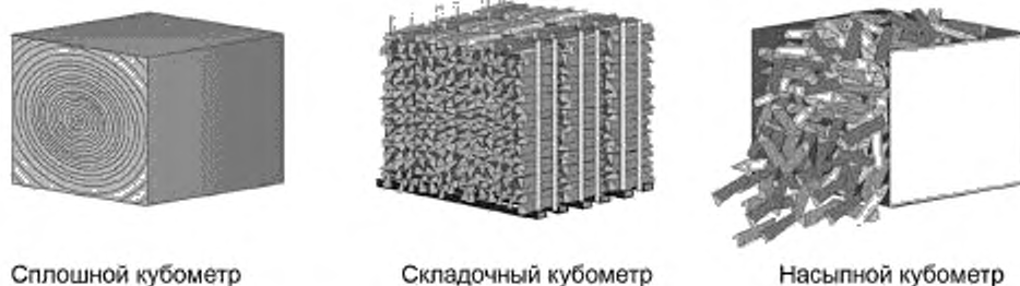
Рисунок В.1 — Разновидности кубометра, как объемной единицы измерения количества дров (каждая сторона равна 1 м) 1)

П р и м е ч а н и е — В Северной Америке используют меру дров — корд. 1 корд — это количество дров (уложенных ровными рядами, параллельно и компактно), занимающее объем 3,62 м 3 (128 куб. фут.).