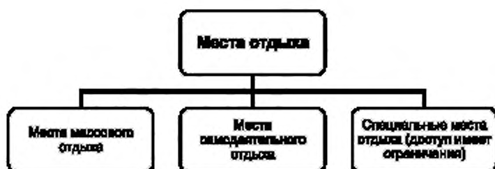
Рисунок А.5 — Виды мест отдыха