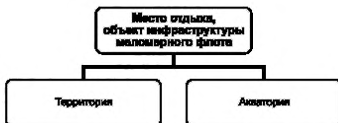
Рисунок А.2 — Структурная схема объекта