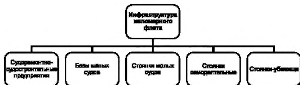
Рисунок А.3 — Функциональная схема инфраструктуры маломерного флота