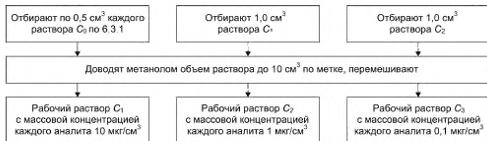
Рисунок 1 — Приготовление рабочих растворов C 1 , C 2 , C 3

Рабочие растворы C 1 , C 2 , C 3 готовят в мерных пробирках вместимостью 10 см 3 в соответствии с рисунком 1.