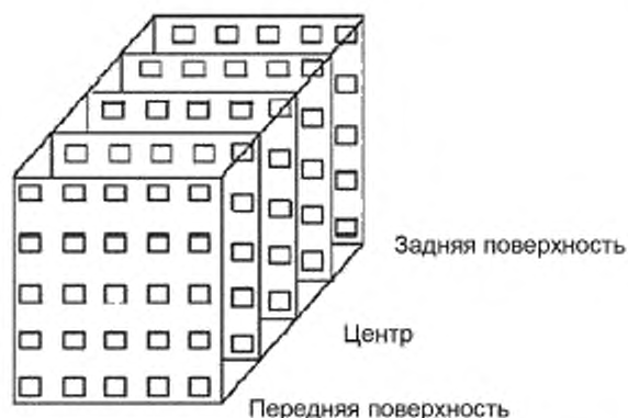
Рисунок 1 — Размещение дозиметров для картирования дозы в контейнере с продуктом в случае фотонного облучения

2 В случае облучения свободно текущей жидкости или порошкообразных образцов картирование поглощенной дозы может оказаться неосуществимым. В таких случаях допустимым вариантом являются теоретические расчеты распределения поглощенной дозы [15]. Для жидкостей практичным решением может быть подвешивание дозиметров в полужидком агаре.