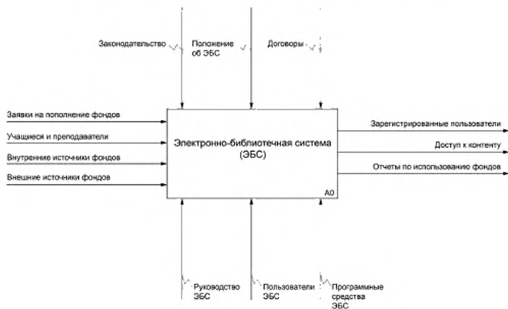
Рисунок А.1 — Контекстная диаграмма