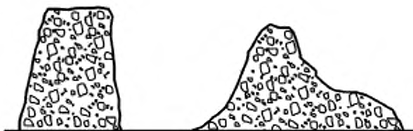
а) Равномерная осадка

Регистрируют равномерную осадку h , как показано на рисунке 1, с точностью до 10 мм.