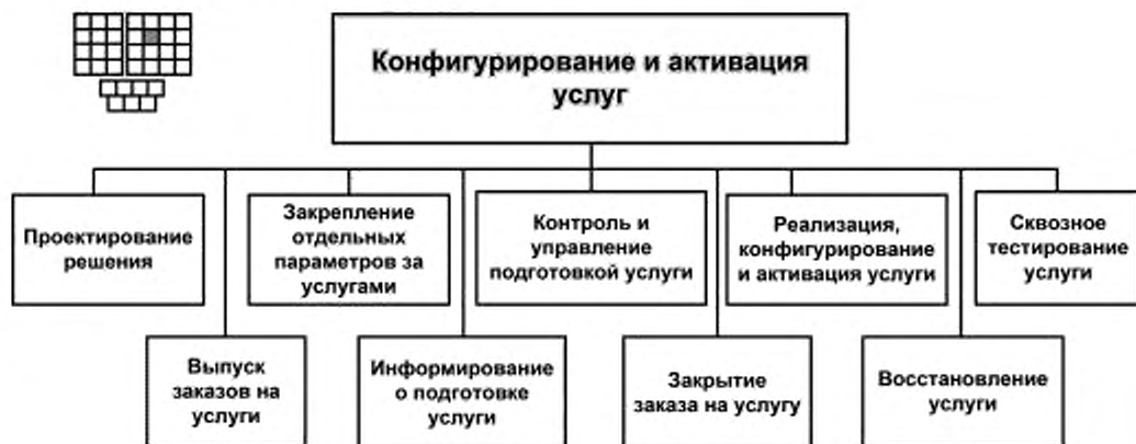
Рисунок 3 — Декомпозиция процесса 1.1.2.2 «Конфигурирование и активация услуг» на элементы процессов уровня 3

6.1 Структура процесса 1.1.2.2 «Конфигурирование и активация услуг» и соответствующие элементы процессов уровня 3 представлены на рисунке 3.