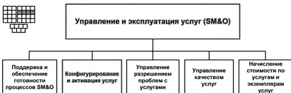
Рисунок 1 — Декомпозиция группы процессов SM&O на элементы процессов уровня 2

5.4 Пиктограмма процесса 1.1.2.2 представлена на рисунке 2, она является общей для всех элементов процессов уровня 3, определенных настоящим стандартом.