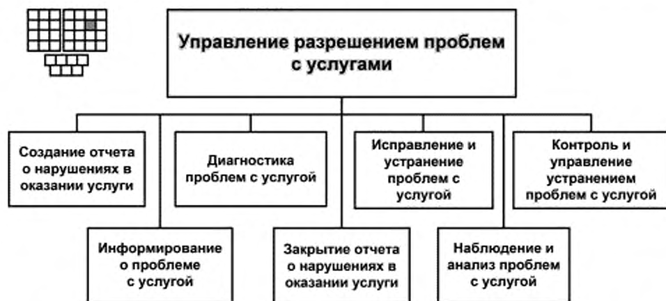
Рисунок 3 — Декомпозиция процесса 1.1.2.3 «Управление разрешением проблем с услугами» на элементы процессов уровня 3

6.1 Структура процесса 1.1.2.3 «Управление разрешением проблем с услугами» и соответствующие элементы процессов уровня 3 представлены на рисунке 3.