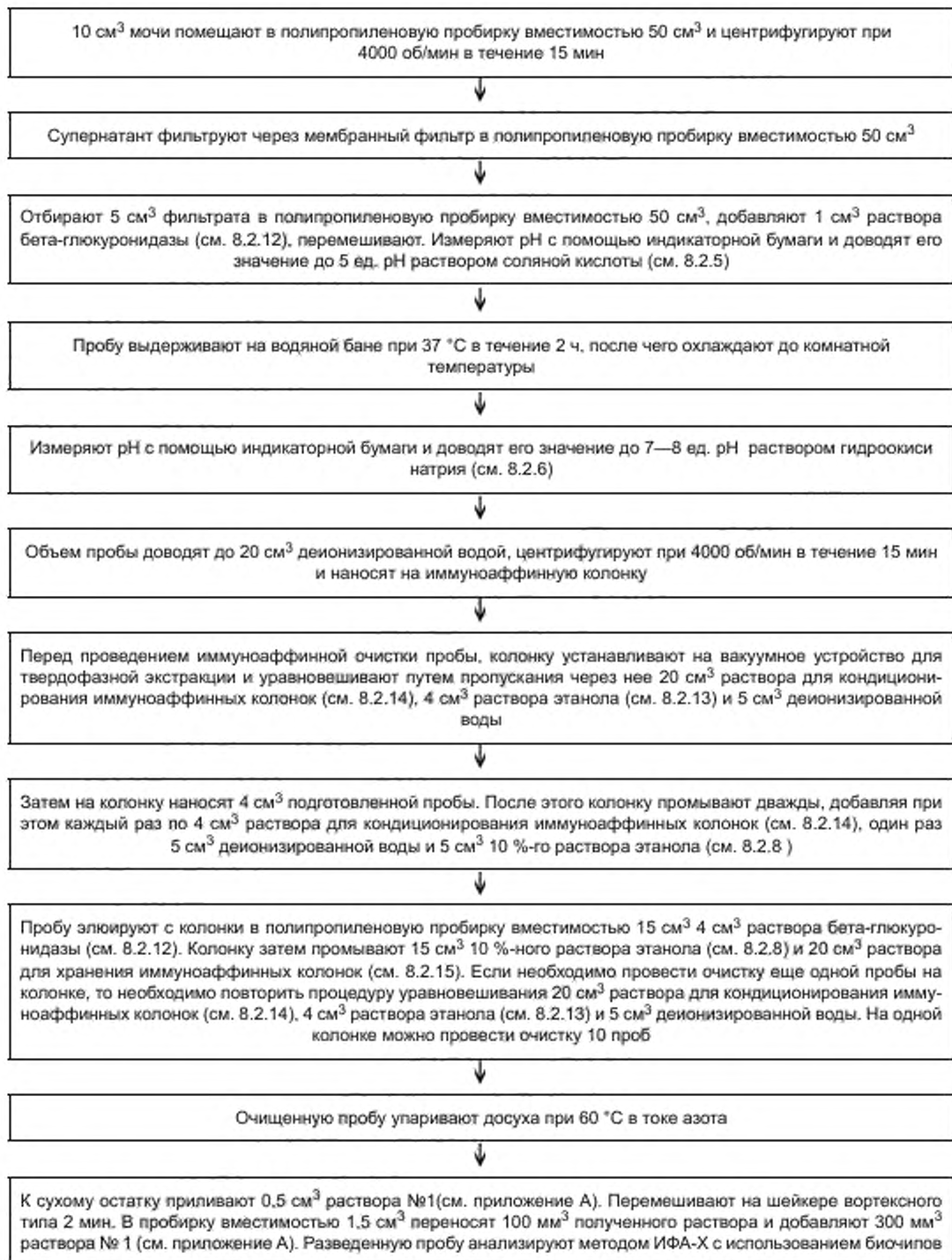
Рисунок 1 — Подготовка проб мочи