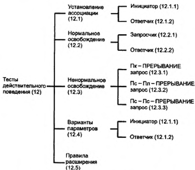
Рисунок 2 — Тесты действительного поведения СЭУА