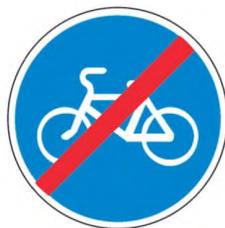
4.4.2 Конец велосипедной дорожки или полосы

дополнить цветными изображениями предписывающих знаков — «4.4.2 Конец велосипедной дорожки или полосы», «4.5.2 Пешеходная и велосипедная дорожка с совмещенным движением», «4.5.3 Конец велосипедной и пешеходной дорожки», «4.5.4 и 4.5.5 Пешеходная и велосипедная дорожка с разделением движения», «4.5.6 и 4.5.7 Конец пешеходной и велосипедной дорожки с разделением движения»: