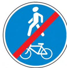
4.5.3 Конец велосипедной и пешеходной дорожки