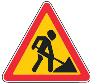
1.25 Дорожные работы

Приложение Б. Раздел 1. Изображение знака 1.25 заменить новым: