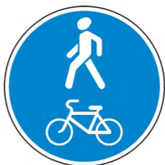
4.5.2 Пешеходная и велосипедная дорожка с совмещенным движением