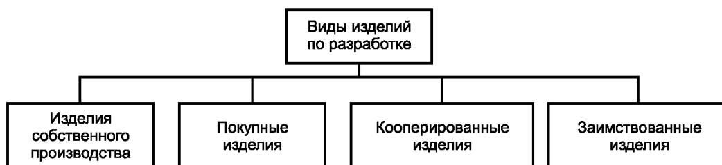
Рисунок А.3 — Виды изделий по разработке

А.3 Виды и структура изделий по разработке приведены на рисунке А.3.