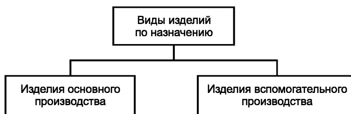
Рисунок А.2 — Виды изделий по назначению

А.2 Виды и структура изделий по назначению приведены на рисунке А.2.