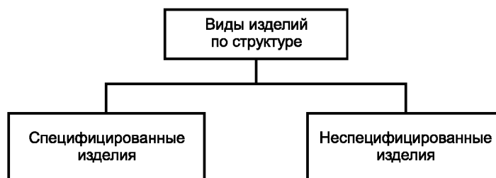
Рисунок А4 — Виды изделий по структуре

А.4 Виды и структура изделий по структуре приведены на рисунке А.4.