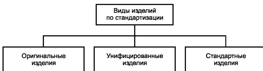
Рисунок А.5 — Виды изделий по стандартизации

А.5 Виды изделий по уровню стандартизации приведены на рисунке А.5.