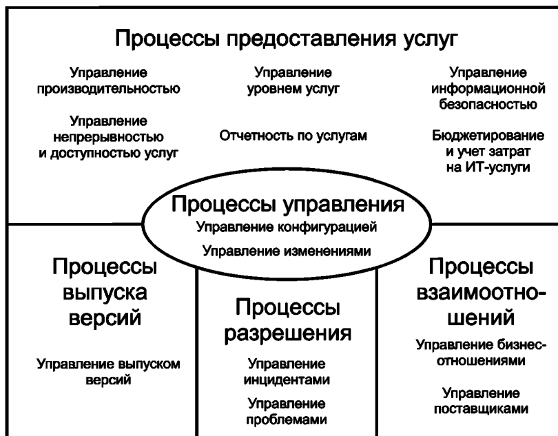
Рисунок D.1 — Процессы управления услугами ([10], рисунок 1)

Если МЕДИЦИНСКИЕ ПРИБОРЫ требуют обслуживания, ремонта, модификации и в итоге замены, то у ИТ-СЕТЕЙ возникают инциденты и проблемы, которые необходимо разрешать, а также необходимость в серьезных изменениях, требующих тщательной реализации. Есть много общего в обслуживании и МЕДИЦИНСКОГО(ИХ) ПРИБОРА(ОВ), и ИТ-СЕТИ(ЕЙ). Для сравнения на рисунке D.1, взятом из [10], показана связь между процессами предоставления услуг ИТ-СЕТЬМИ.