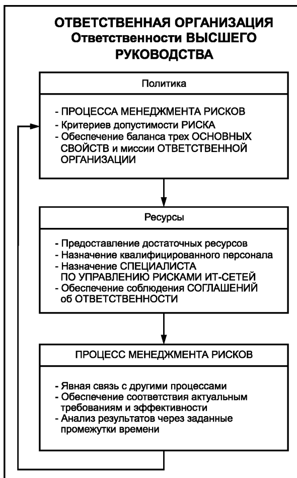
Рисунок 1 — Обязанности ВЫСШЕГО РУКОВОДСТВА

Соответствие требованиям настоящего подраздела проверяют путем экспертизы ФАЙЛА МЕНЕДЖМЕНТА РИСКОВ МЕДИЦИНСКОЙ ИТ-СЕТИ.