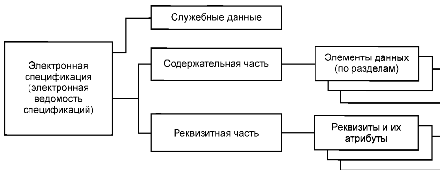
Рисунок 1 — Обобщенная структура ЭСП и ЭВС (верхнего уровня)

4.6 ЭСП (ЭВС), как правило, следует оформлять с применением ЭП (при наличии в АС средств, обеспечивающих проведение проверки подлинности ЭП). В этом случае порядок использования ЭП и источник сертификата ЭП устанавливаются стандартом организации — разработчика ЭСП (ЭВС).