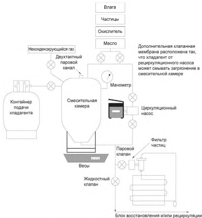
Рисунок АА.1 – Испытательная аппаратура для автономного оборудования

Контрольно-измерительная аппаратура, способная измерить массу, температуру, давление и потери хладагента (при необходимости).