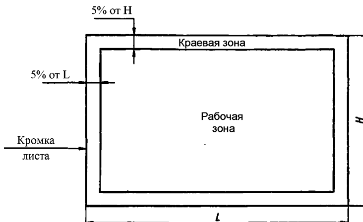
Рисунок 2 – Осматриваемые зоны стекла с покрытием конечного размера

Краевая зона составляет 5 % от длины ( L ) и 5 % от ширины ( H ) листа стекла.