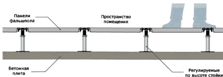
Рисунок 1. Система фальшпола.

Схема сборно-разборных фальшполов представлена на рисунке 1.