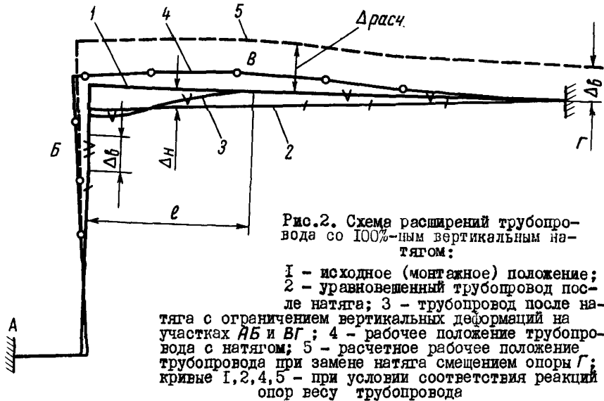
Рис.2. Схема расширений трубопровода со 100%-ным вертикальным натягом:

1 - исходное (монтажное) положение; 2 - уравновешенный трубопровод после натяга с ограничением вертикальных деформаций на участках АВ и ВГ ; 3 - трубопровод после натяга с натягом; 4 - рабочее положение трубопровода с натягом; 5 - расчетное рабочее положение трубопровода при замене натяга смещением опоры Г ; кривые 1, 2, 4, 5 - при условии соответствия реакции опор весу трубопровода